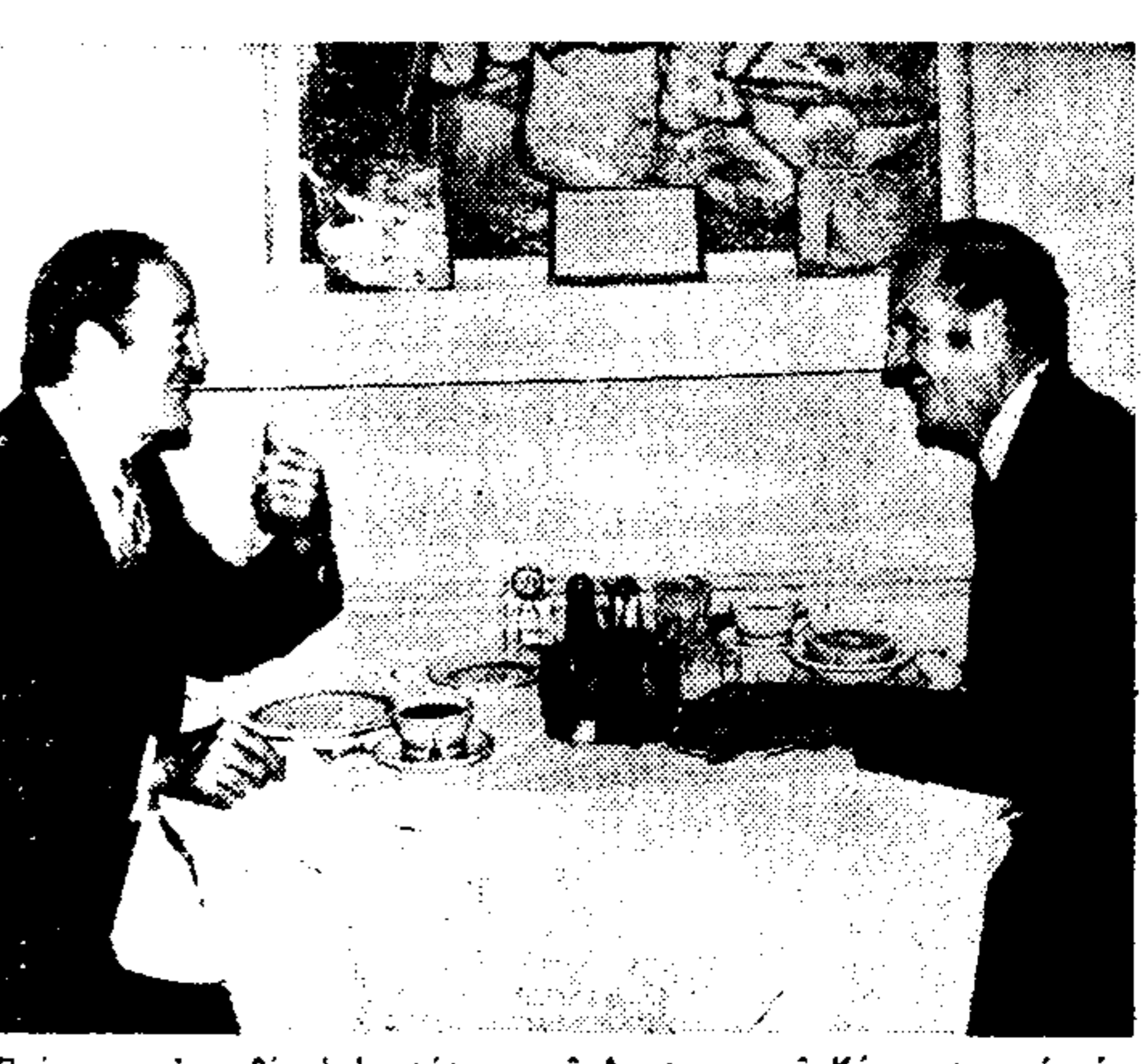
Πρόγραμμα είχε χθές ό ύποψήφιός τού Δημοκρατικού Κόμματος για τήν προεδρία...