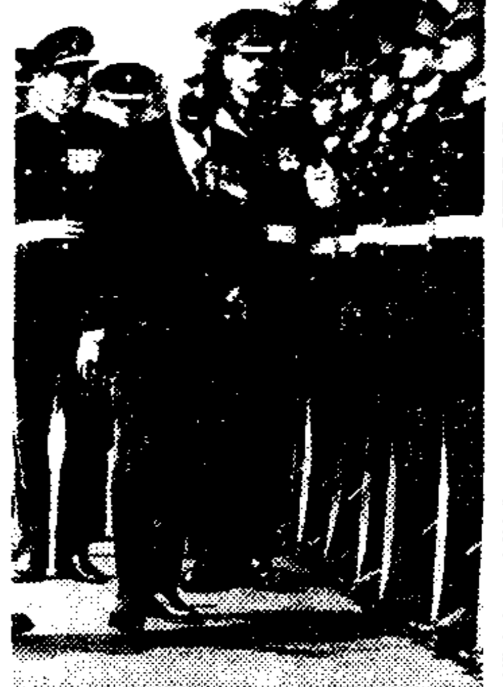
Ό πρωθυπουργός κ. Χρήστος Κωνσταντίνου...