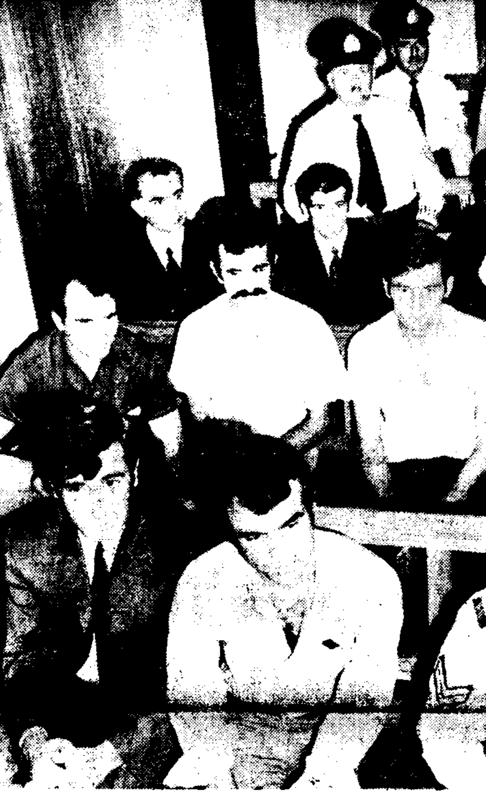
Οι δικάσιμοι στό Έκτακτο Στρατοδικείο Αθηνών για συγκρότηση συνθητικής κατ' παρανομήν όργανώσεως...